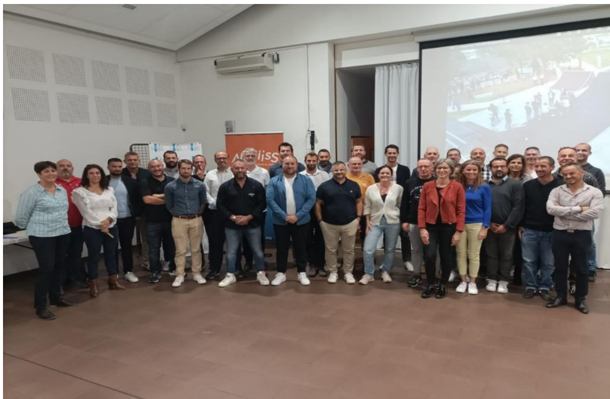
Une partie de la délégation ANDIISS Occitanie (Adhérents + Partenaires)