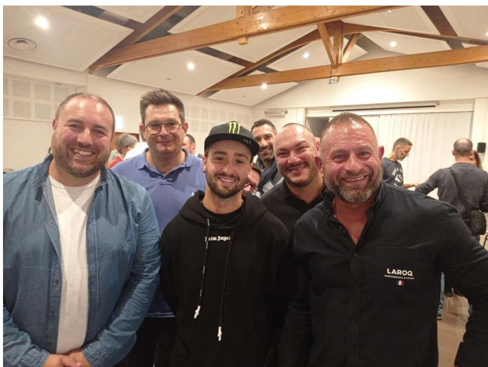
Anthony JEANJEAN Athlète Olympique (au centre) – TOP 3 Mondial