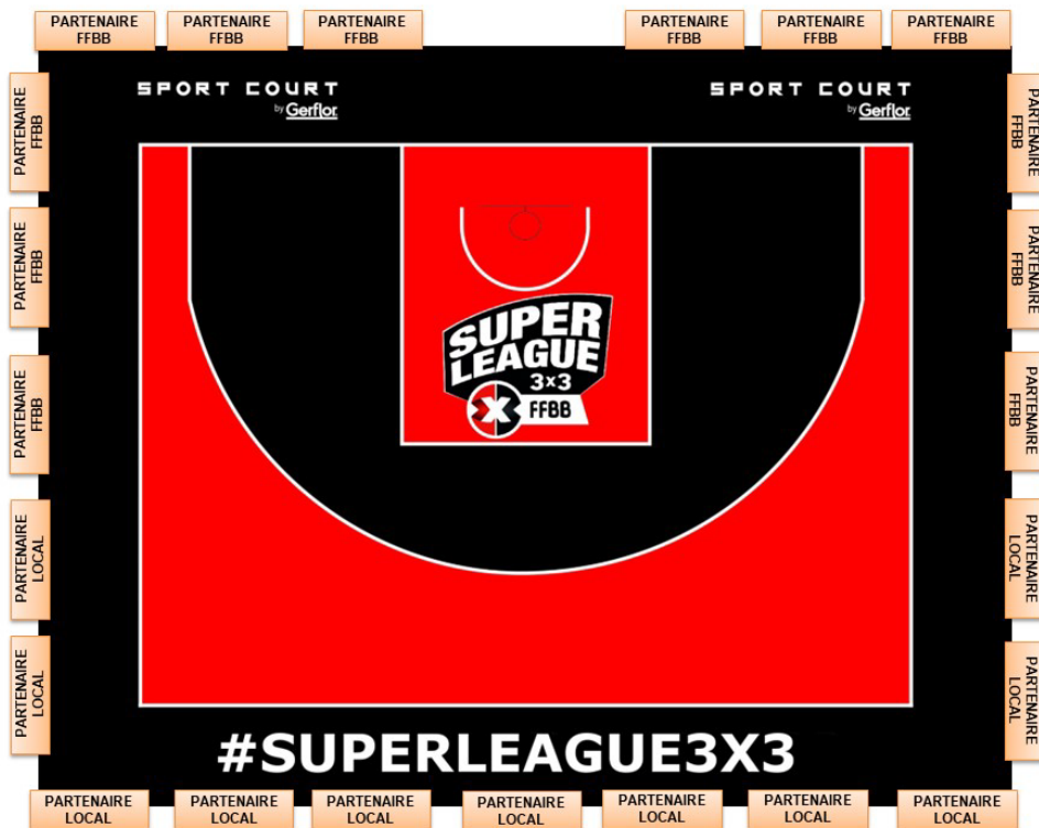
Schéma d'implantation de la panneautique du terrain principal

Flammes à disposer sur le site à proximité du terrain central :