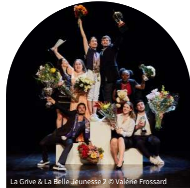
La Grive & La Belle Jeunesse 2

Président du conseil départemental de Seine-Saint-Denis