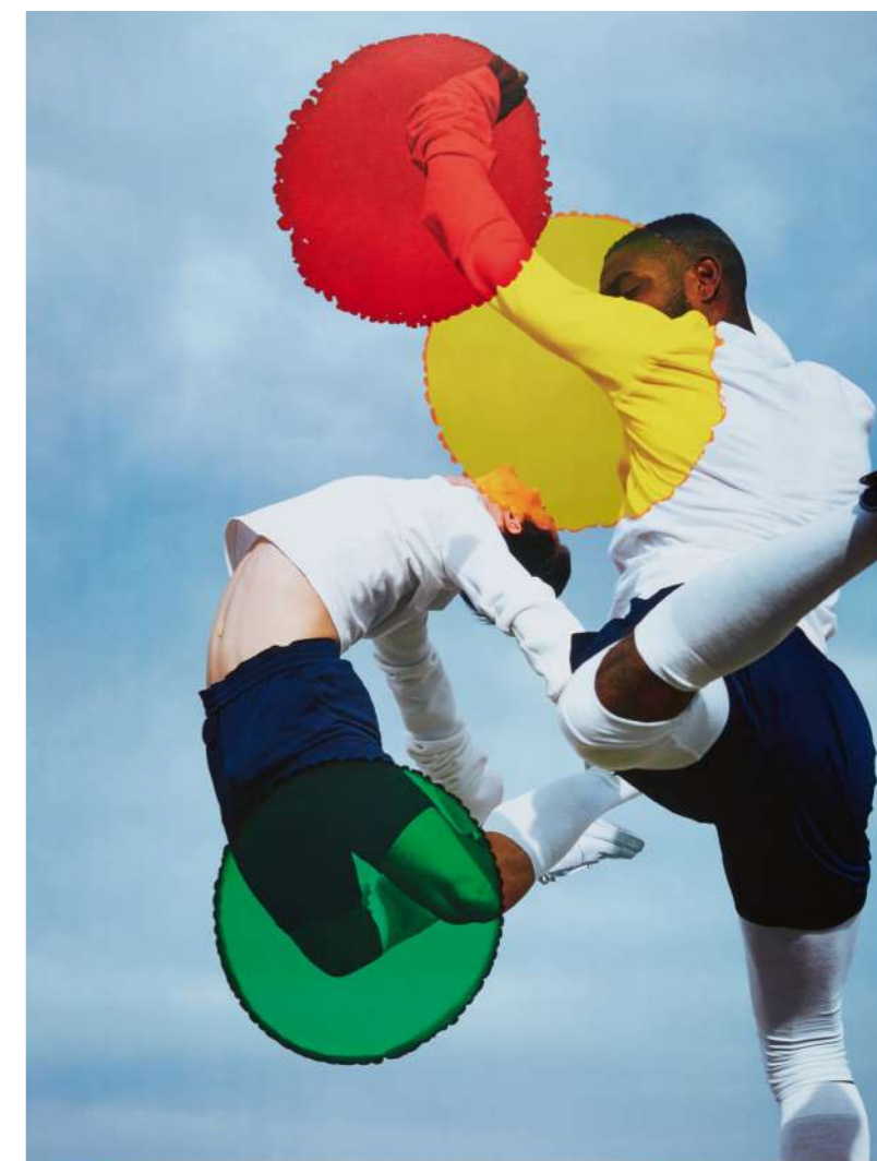
Viviane Sassen - Ludus © Affiche artistique pour les Jeux Olympiques de Tokyo 2020 «Ludus», Viviane SASSEN

En s'appuyant sur les richesses de cette diversité esthétique, la programmation de l'Olympiade Culturelle contribuera à créer des « Jeux Olympiques et Paralympiques à la française ».