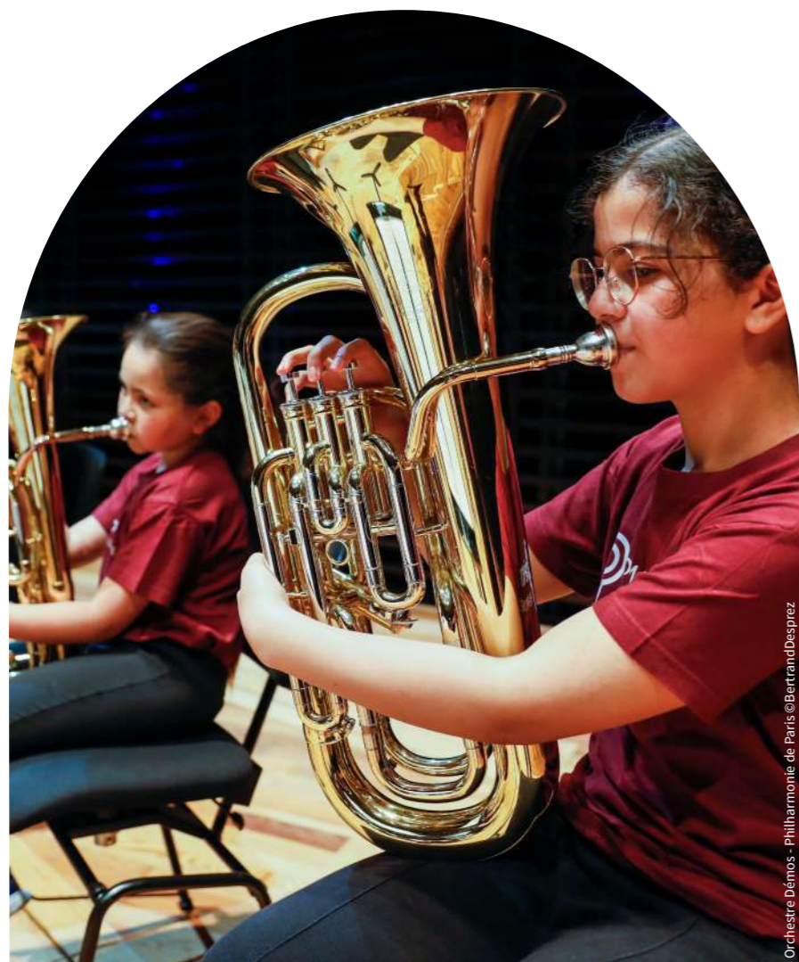
Orchestre Démon - Philharmonie de Paris

Au-delà des émotions esthétiques qu'elle fait naître, la rencontre entre le sport et l'art décroisse les publics et contribue à la démocratisation de la culture.