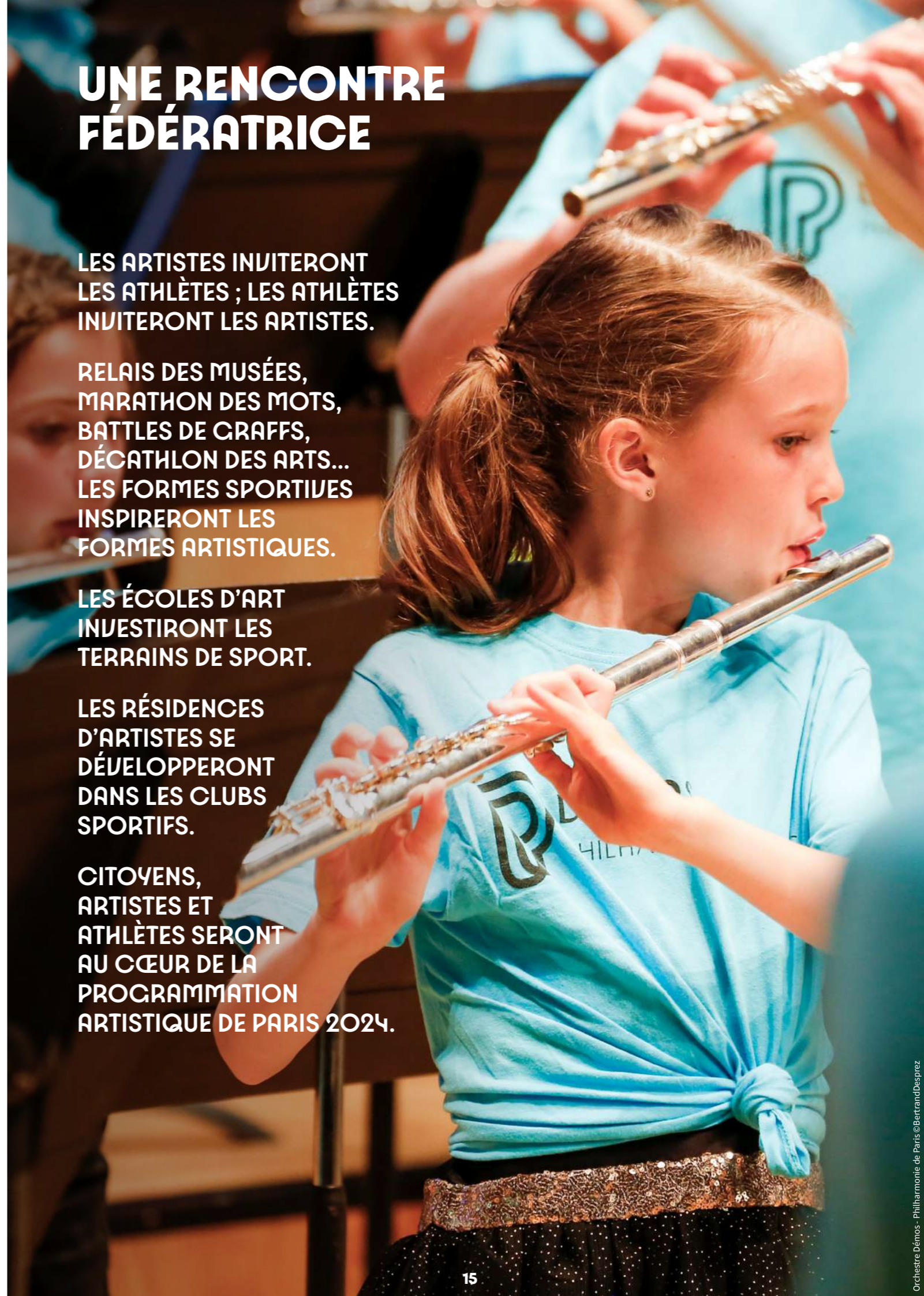
Orchestre Démon - Philharmonie de Paris

CITOYENS, ARTISTES ET ATHLÈTES SERONT AU CŒUR DE LA PROGRAMMATION ARTISTIQUE DE PARIS 2024.