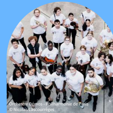
Orchestre Démos - Philharmonie de Paris